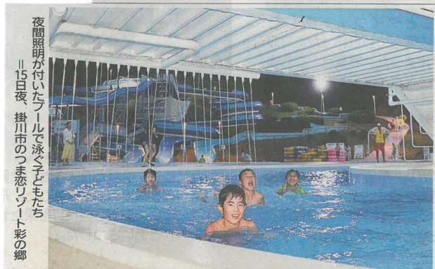
夜間照明が付いたプールで泳ぐ子どもたち 15日夜、掛川市つま恋リゾート彩の郷

は新たに夜間照明を設け、連日午後7時から午後8時まで施設内のステージで音楽バンドの日替わり生演奏も実施する。営業は9月18日まで。